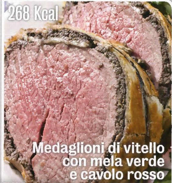
268 Kcal Medaglioni di vitello con mela verde e cavolo rosso

Esecuzione: Condire il cavolo con l'olio, l'aceto, la senape, regolare di sale. Appassire i fiammiferi di mela in padella con coperchio, pochi minuti, raffreddare e aggiungere al cavolo. Grigliare i medaglioni di vitello e salare. Disporre al centro del piatto l'insalata di cavolo, adagiare i medaglioni, cospargere i semi di lino. ● Una fetta media (30 g) di pane integrale ● Uva bianca o nera (150 g).