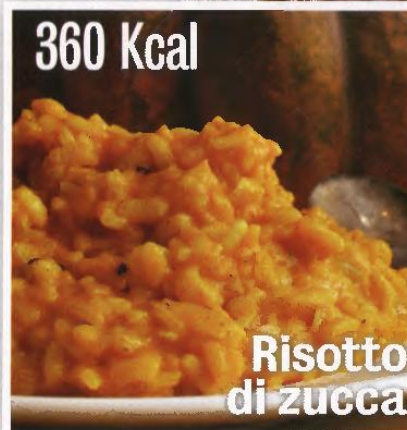
360 Kcal Risotto di zucca

Esecuzione: Appassire lo scalogno con l'olio, aggiungere il riso, tostare, quindi bagnare con il vino bianco e lasciare evaporare totalmente. Aggiungere la metà del brodo ed il successivo poco per volta, cuocere ancora per 8 minuti circa, aggiungere la zucca, cuocere ulteriori 5 minuti. Mantecare con il parmigiano grattugiato e l'erba cipollina tritata finemente.