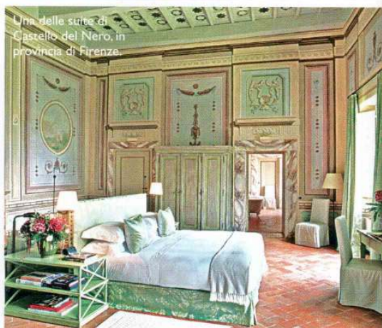
Una delle suite di Castello del Nero, in provincia di Firenze.