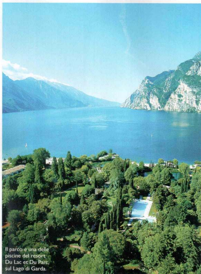
Il parco e una delle piscine del resort Du Lac et Du Parc, sul Lago di Garda.