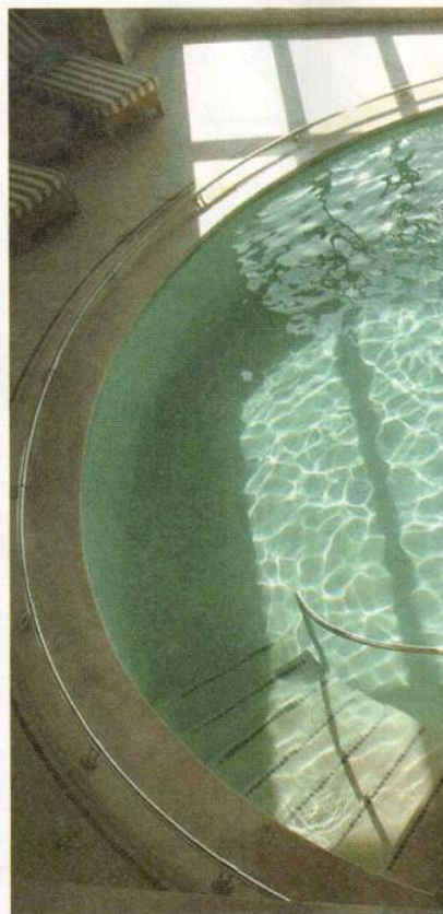
Toscana: piscina Bioacquam al Fonteverde Resort