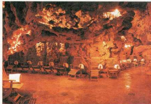
Toscana: grotta millenaria al Grotta Giusti Natural Spa Resort