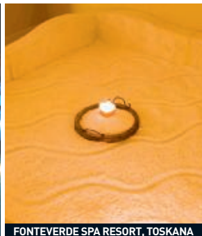
FONTEVERDE SPA RESORT, TOSKANA